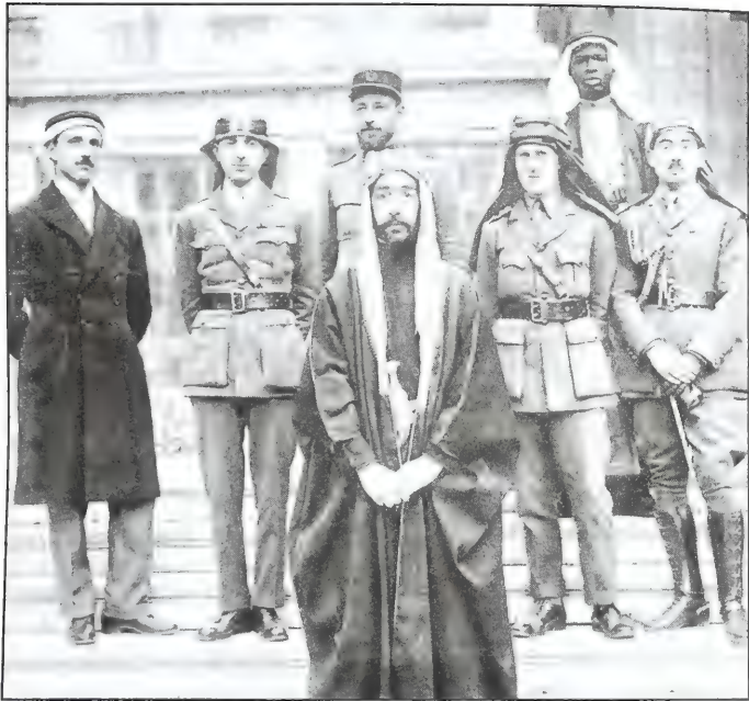
تجمع هذه الصورة التي التقطت خلال الزيارة، الأمير فيصل بن الشريف حسين ونوري السعيد ورستم حيدر ومرافقه تحسين قدري، وفائز الغصين وتوماس إدوارد لورانس.

ألقى فيصل بن الحسين خطاباً مهماً في قاعة المؤتمر وهو بزيّة العربي الذي أثار اهتمام الحضور والمشاركين، وكان لورانس يترجم له خطابه وتصريحاته. ومما جاء في الخطاب قراءته مذكرة أعدها خصيصاً للمؤتمر، فقال: «جئت ممثلاً لوالدي الذي قاد الثورة العربية ضد الترك تلبية منه لرغبة بريطانيا وفرنسا لأطالب بأن تكون الشعوب الناطقة بالعربية في آسيا من خط الإسكندرونه - ديار بكر حتى المحيط الهندي جنوباً، معترفاً باستقلالها وسيادتها بضمّان من عصبة الأمم. ويستثنى من هذا الطلب الحجاز وهو دولة ذات سيادة، وعدن وهي محمية بريطانية». ويستطرد قائلاً: «ويعد التحقق من رغبات السكان في تلك المنطقة، يمكننا أن نرتب الأمور فيما بيننا، مثل تسييت الدول القائمة فعلاً في تلك المنطقة،